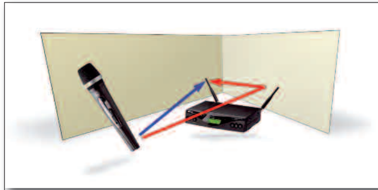
Abb. 2: Mehrwegausbreitung durch Reflexion

soll, ist der Vorverstärker im Handsender entsprechend empfindlicher einzustellen (mehr Gain) als wenn er für den Shouter einer Crossover-Band erhalten soll. Einen weiteren Grund für vernehmbares Rauschen hat man heute bei modernen Drahtlosanlagen mit Kompartertechnik recht gut im Griff. Die Übertragung via Funk bietet prinzipiell ein relativ schlechtes Signal-/Rauschverhältnis. Daher wird im Sender das Audiosignal komprimiert und im Empfänger wieder expandiert. So wird der eingeschränkte Dynamikbereich des Nadelöhrs Äther optimal genutzt. Des Weiteren trägt meist eine Pre- und De-Emphasis, ähnlich wie es manch einer vielleicht noch von alten Bandmaschinen mit Dolby kennt, zu einem besseren Störgeräuschabstand bei. Dabei werden im Sender hohe Frequenzbereiche angehoben und im Empfänger wieder in gleichem Maße abgesenkt. Das Anheben im Sender ist unproblematisch, da der Energiegehalt hoher Frequenzen relativ ge-